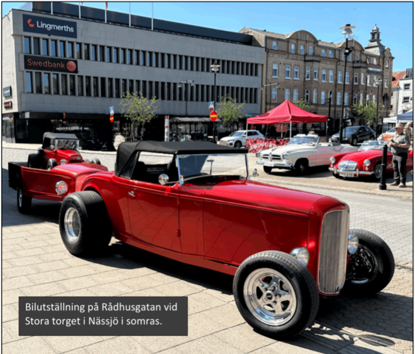
Bilutställning på Rådhusgatan vid Stora torget i Nässjö i somras.

Framvagnen är tillverkad i egen konstruktion av Volvo, Saab och Ford-delar. Motorn är en Chrysler "smallblock 318". Även växellåda och bakaxel är Chrysler.