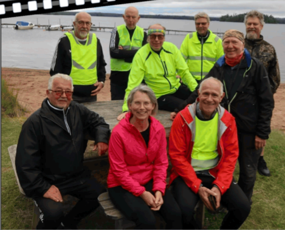
Ett cykelglatt gäng samlat till gruppfoto.